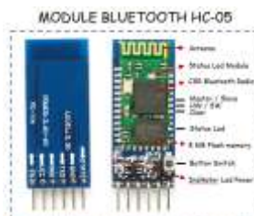
Gambar 3 Module HC-05 Bluetooth

Ada dua jenis bluetooth ke modul serial dengan ganjil dan genap. Bluetooth seri bernomor ganjil sebagai HC 05 atau HC-03 adalah versi perbaikan dari Bluetooth untuk Serial Module HC-06 atau HC-04. Bluetooth ke serial modul HC-05 dapat ditetapkan sebagai master atau slave perangkat seperti HC-06 modul yang hanya bisa digunakan sebagai Slave. Bluetooth konfigurasi modul pin Serial HC-05 ditunjukkan pada Gambar 3.