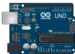
Gambar 2 Arduino Uno R3

Pengembangan prototype berbasis mikrokontroler yang sering digunakan dalam physical computing saat ini lebih sering disebut Arduino. Perangkat ini juga dikatakan sebagai sebuah platform dari physical computing yang bersifat open source. Arduino tidak hanya sekedar sebuah alat pengembangan, tetapi kombinasi dari hardware, bahasa pemrograman dan Integrated Development Environment (IDE). IDE adalah perangkat lunak (software) yang berperan menulis program, meng-compile program menjadi kode biner dan mengupload kedalam memori mikrokontroler [4]