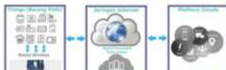
Gambar 1. Konsep IOT