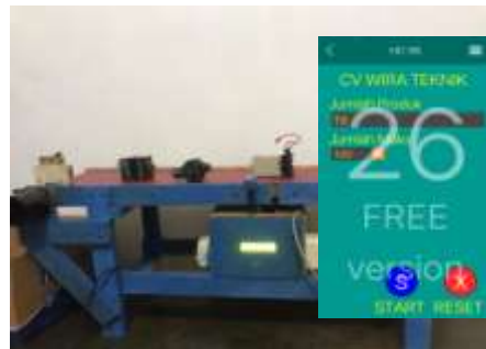
Gambar 8. Monitoring aplikasi RemoteXY pada smartphone